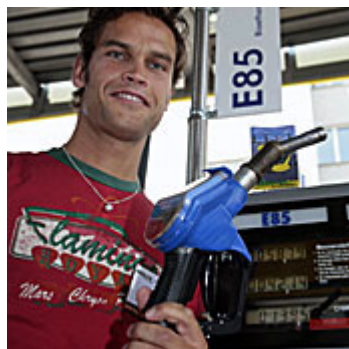
Tankt umweltfreundliches Bioethanol: Ex-Mister Schweiz Renzo Blumenthal

Umweltschonender Treibstoff soll billiger, unvermischtes Benzin dagegen teurer werden. Dabei will der Ständerat Flüssiggas steuerlich weniger stark begünstigen als Erdgas. Bei der Änderung des Mineralölsteuergesetzes hat er Differenzen zum Nationalrat geschaffen.